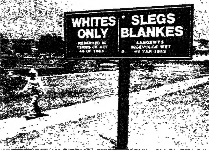
رجل سود يجتاز حديقة عامة في كيرلونغ فيل مخصصة للبيض

قالت شرطة جنوب أفريقيا امس ان مشرفا على مجمع سكني للمعلم قتل برصاص اثنين من السود كانا وسط جماعة كثرين هددهم فيما زعم انهم اضطراريات في ميناء والفيس باي. وقالت شرطة بريتوريا ان مشرف، هدده فيما زعم جماعة كبيرة من السود، الرصاص من مسدس واصيب بجراح بجروح قاتلة. وقالت ايضا ان الشرطة استخدمت الغاز المسيل للدموع، ثلاث مرات امس الاول لتفريق جماعات غير مشروعة في والفيس باي وهو ميناء رئيسي.